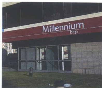
O Millennium BCP foi o primeiro cliente a implementar esta solução

O servidor representa uma solução completa para os bancos que já oferecem um serviço de Internet Banking, e que procuram alargar a sua oferta de serviços de forma a incluir a integração com Software de Gestão de Finanças Pessoais. O Millennium BCP foi o primeiro cliente a implementar esta solução. ■